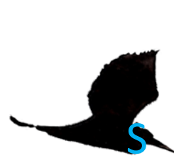
Reiher im Flug

Hals: im Flug S-förmig gekrümmt (Storch: gerade ausgestreckt)