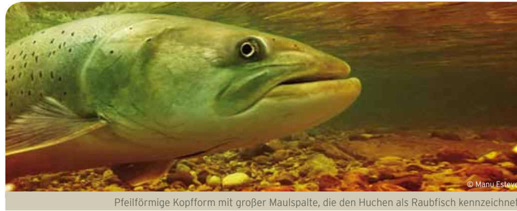
Pfeilförmige Kopfform mit großer Maulspalte, die den Huchen als Raubfisch kennzeichnet

Besatzversuche, den Huchen außerhalb seines natürlichen Verbreitungsgebietes anzusiedeln, blieben mit wenigen Ausnahmen (Polen, Spanien) bis dato erfolglos.