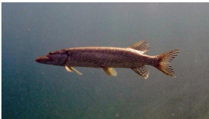
Gute Elterntiere = gute Jungfische?

Aber auch Totholz ist als Laichsubstrat, Schutz und Nahrungsquelle für viele Fischarten geeignet und kann relativ kostengünstig in Gewässer eingebaut, bzw. über lange Zeit belassen werden.