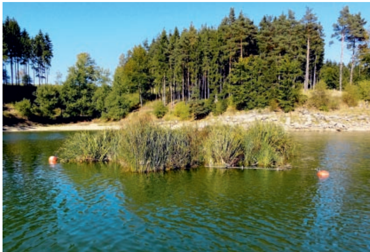
Natürliche Gewässerstrukturen geben vielen Fischarten die Möglichkeit zur Reproduktion.

In Stauräumen, wo Pegelschwankungen für massive Beeinträchtigungen in Bezug auf die Reproduktion sorgen können, haben sich besonders sogenannte „Schwimmkampen“, (siehe Foto oben) das sind Inseln die mit Pflanzen bewachsen sind, bewährt. Vor allem Krautlaicher wie der Hecht, Karpfen und eine Vielzahl von Kleinfischarten nutzen diese Strukturen zur Fortpflanzung. Solche Inseln fungieren zudem als Schutz und Nahrungsquelle, speziell für Jungfische.