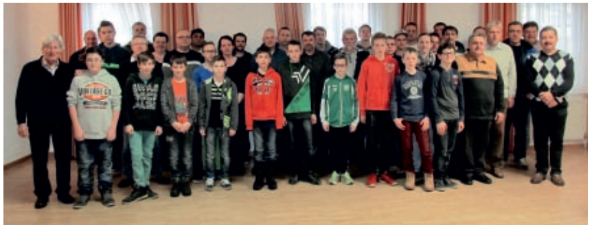
Der Fischerkurs vom Haringsee. Begeisterte Teilnehmer aus Groß Enzersdorf