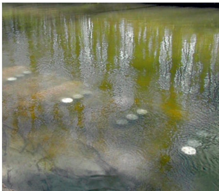
Versuchsanordnung an der Leitha